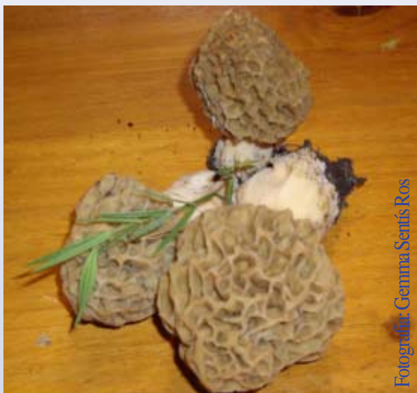
Fotografia: Gemma Semis Ros