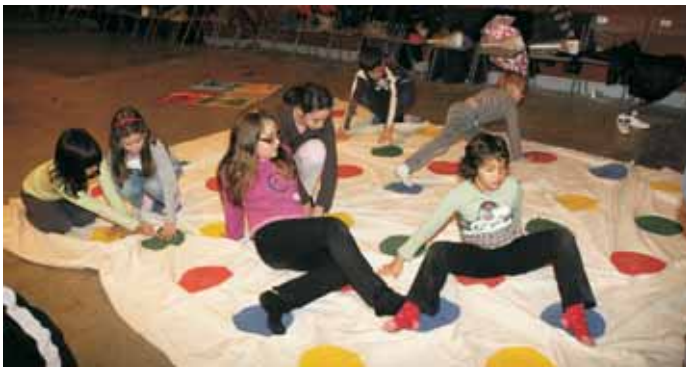
Juguem al Mercat!, jocs i tallers per a infants (del 28 de desembre al 5 de gener)