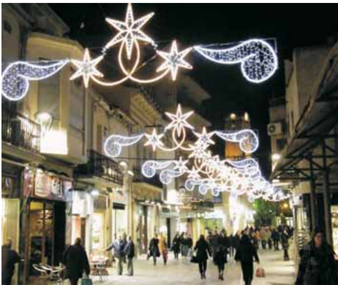
Llums de Nadal als carrers de la ciutat