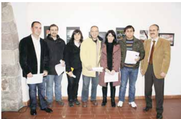
Els guanyadors del Concurs de Fotografia de l'any passat.

Amb el Pla Estratègic hem treballat com volem la ciutat. Per Sant Vicenç us ho explicarem. Us en demanarem l'opinió.