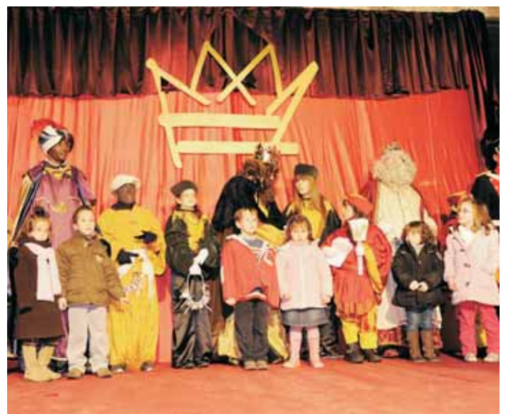
Cavalcada de Reis 2010 (5 de gener)