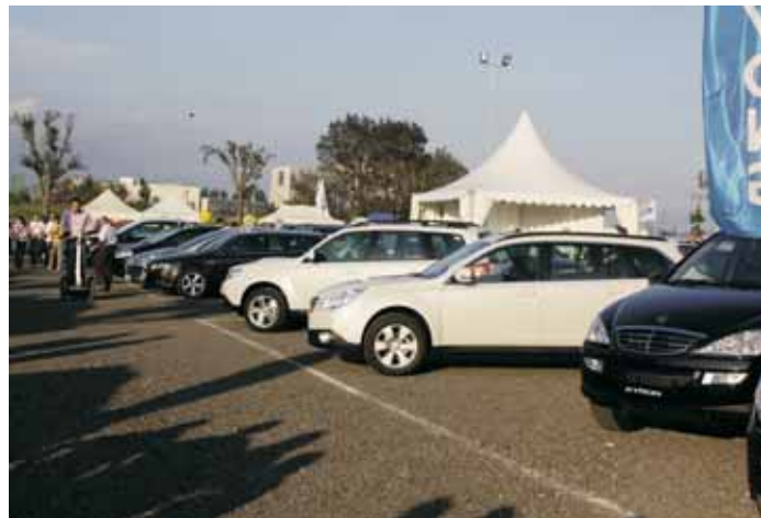
El sector de l'automoció a l'espai exterior del FIMO

Es tracta d'un pas més que fa l'Ajuntament de Mollet en el seu objectiu de facilitar les gestions a la ciutadania i implantar l'anomenada administració electrònica. Fins ara, a través del web municipal es podien realitzar només alguns d'aquests tràmits.