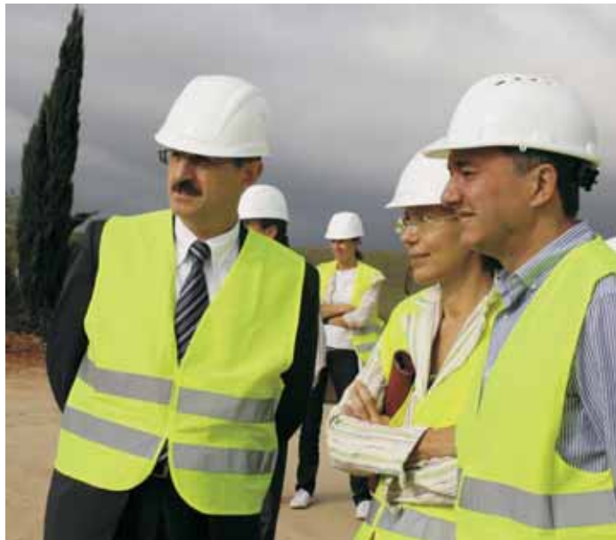
L'alcalde de Mollet, Josep Monràs i la consellera de Justícia, Montserrat Tura, comproven l'inici de la primera fase de construcció del futur edifici judicial.

Ja fa anys que Mollet demana aquest nou equipament ja que l'actual ubicació dels jutjats, al carrer d'Anselm Clavé, s'ha quedat petita pel volum d'activitat que rep diàriament. Aquest projecte respon a la voluntat de millorar l'atenció a les persones que s'adrecen a l'administració de Justícia i dotar el servei d'instal·lacions dignes i equipades amb les darreres tecnologies.