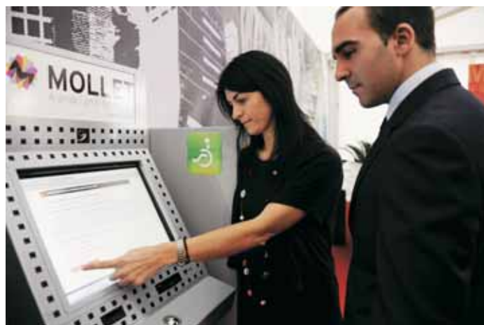
Els visitants van poder provar la nova administració electrònica