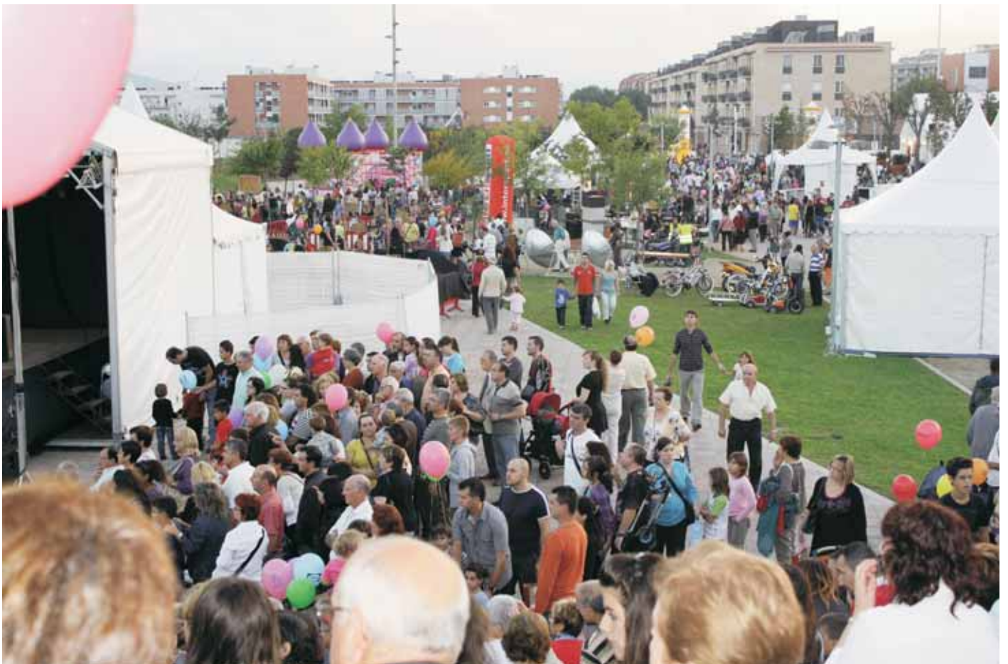
Vista exterior del nou espai de FIMO al parc de Ca l'Estrada

En aquesta edició, FIMO també ha reservat un espai de convidats dedicat a l'illa italiana de Sardenya (concretament, a la ciutat de l'Alguer), una important ciutat portuària i turística que atreu cada any major nombre de visitants catalans. A l'estand de FIMO, el visitant podia informar-se dels atractius turístics, patrimonials i gastronòmics de Sardenya i de l'Alguer.