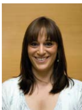
Ester Safont Artal 2a tinenta d'Alcaldia

Àmbits de responsabilitat: ■ -Planejament Urbanístic ■ -Recursos Humans ■ -Economia ■ -Seguretat Ciutadana i Protecció Civil ■ -Tecnologies de la Informació i les Comunicacions ■ -Regidor delegat del barri de l'Estació del Nord