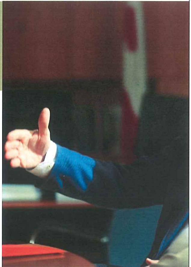
L'alcalde de Mollet destaca que l'activitat constructora a la ciutat no s'ha aturat malgrat la Covid

Per aquests fets, la UGT ha entrat un escrit a l'Ajuntament dient que hem de defensar els funcionaris públics. Segons l'informe, que els mateixos implicats reconeixen, el que va passar és que un grup de gent estava enganxant cartells a la ciutat, tots de fora de Mollet, i una patrulla de policia va intentar identificar-los. Una d'aquestes persones va fugir. La policia el va perseguir i va oferir resistència. En aquell moment es van acostar altres persones que estaven amb ell, i van intentar assetjar el policia. Es van presentar altres patrulles, també de Mossos, i van fer una identificació per intent d'agressió a un funcionari públic que, per altra banda, té un part de lesions, i això ningú ho ha volgut discutir. Tots els grups han rebut informació en comissió i Comuns i ERC no pot al·legar desconeixement. Penjar cartells en