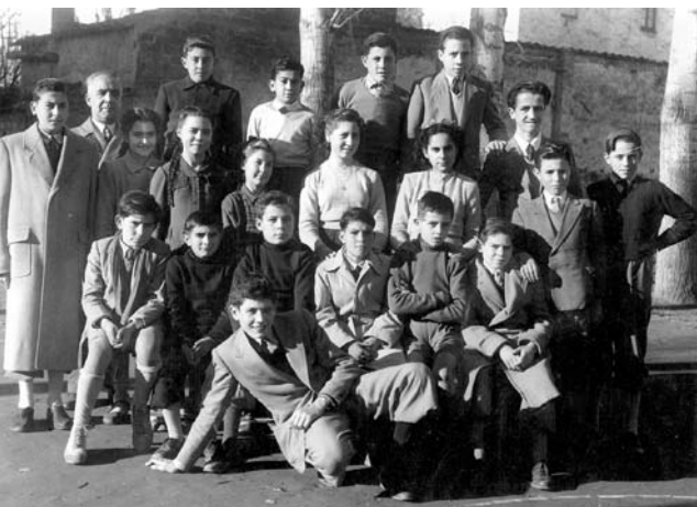
Figura 11. Alumnes de l'Acadèmia Viñas amb el Sr. Viñas, els anys 40.

a curiositat, el pupitre del mestre estava situat en una porta oberta en una paret que dividia dues aules, la dels nens i la de les nenes. Així el mateix professor podia vigilar les dues aules situant-se davant la porta. 25