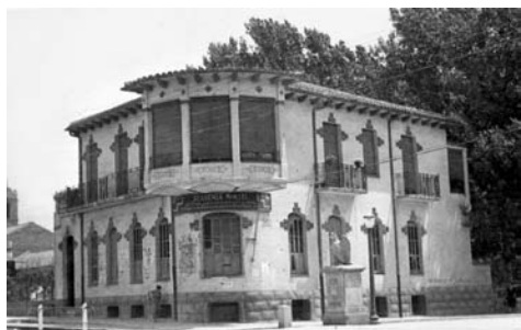
Figura 10. Edifici històric de l'Acadèmia Viñas, els anys 40. A la foto es pot veure una de les àguiles sobre pedestal que presidien l'inici de la rambla.

motiu, les persones que van patir el seu mal geni l'excusen perquè creuen que si van poder estudiar batxillerat és gràcies a la seva acadèmia (en cas contrari, haurien hagut de desplaçar-se a Barcelona o Granollers, cosa que moltes famílies no podien permetre's).