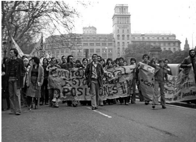
Figura 1. Manifestació en defensa del contracte laboral i contra les oposicions. Any 1978.

Aquests centres constituïren amb més o menys intensitat o convicció el nucli del conservadorisme escolar durant la dècada. L'escola privada catòlica, Col·legi Lestonnac, o liberal, Acadèmia Mollet, no