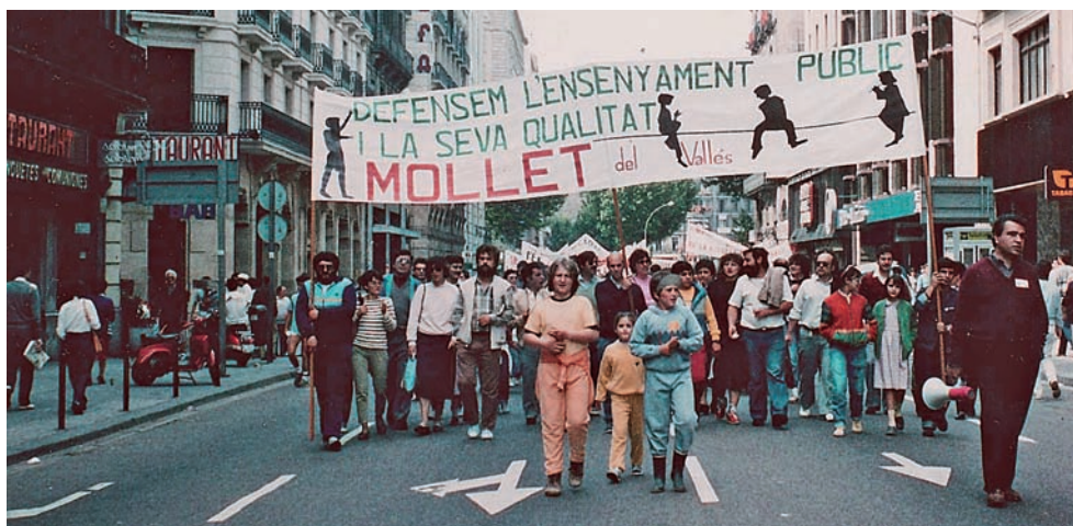
Figura 4. El nombrós grup de Mollet a la manifestació en defensa de l'escola pública, l'any 1985.

L'altra font de conflictivitat fou la qüestió de la llengua. Durant la dècada de 1970 s'havia anat covant la formació d'un model d'escola catalana que esclata amb força quan no hi ha el control de la dictadura. Val a dir que en la introducció de la llengua catalana a l'escola hi fa tant o més la iniciativa de la base, pares i mestres, que la de les institucions governamentals. La Llei de normalització lingüística a Catalunya (1983) posa les bases perquè el català sigui la llengua habitual a l'escola amb coneixement i ús per part d'alumnes i professors. El problema de la llengua catalana a l'escola només té dos hàndicaps als quals ha de fer front: l'oposició mediàtica de l'espanyolisme i la resistència inicial d'una part del nombrós sector de mestres que desconeixen la llengua o bé no en tenen un coneixement suficient per ensenyar-la. L'oposició mediàtica hi serà al llarg dels