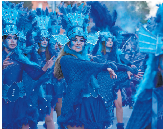
Premi Ajuntament, a la segona comparsa local 600 €

Tema: Metamorfosi Associació de Veïns Santa Rosa