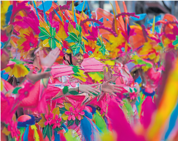
Premi Ajuntament, a la millor comparsa local 1.000 €

Tema: Metamorfosi Associació de Veïns Santa Rosa