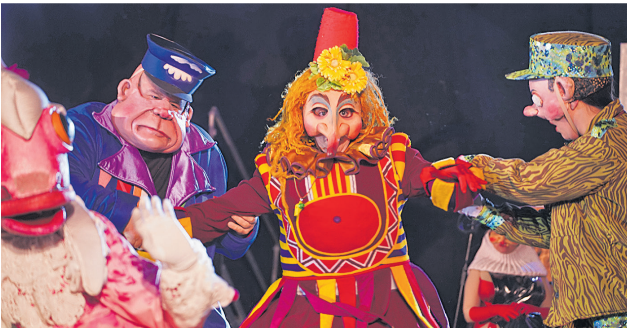
Processó i l'Enterrament de la sardina

El Carnaval ha finalitzat, com és tradicional, amb la Processó i l'Enterrament de la sardina. Hi ha participat la banda d'alumnes de l'Escola Municipal de Música i Dansa de Mollet del Vallès i la Companyia Carnamolles.