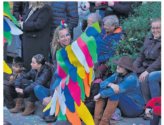
Premi Mobles Chacón, a la millor comparsa infantil o juvenil 250 €

Tema: Valkírias CIRQS (Montcada i Reixac)