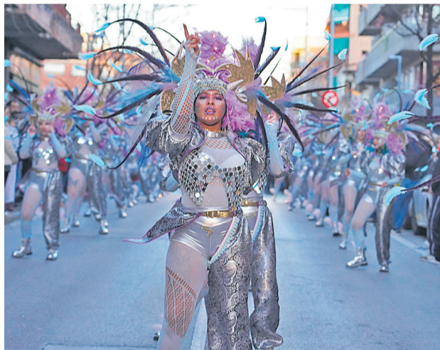
Premi Ajuntament, a la segona millor comparsa de fora de Mollet 600 €

Tema: Oh la la the muskeeters Grup Endansa (Montcada i Reixac)