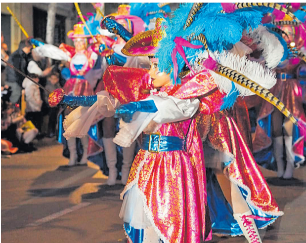
Premi Ajuntament a la millor comparsa de fora de Mollet 1.000 €

Tema: Vida del jardí AMPA Centre d'Estudis Mollet