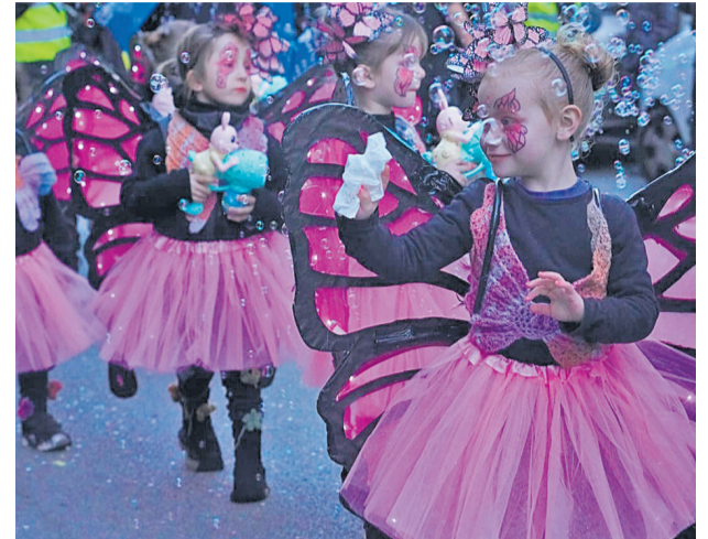
Premi JFG Car Àudio, a la tercera millor comparsa local 300 €

Tema: Vida del jardí AMPA Centre d'Estudis Mollet