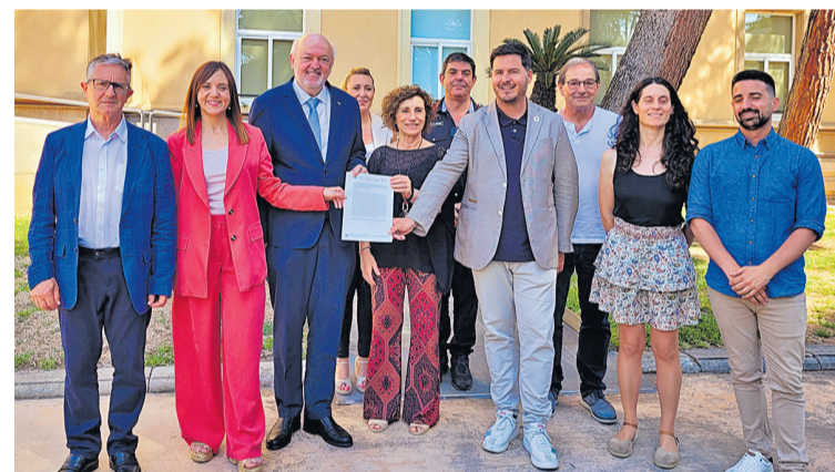
Els ajuntaments de Mollet del Vallès, La Llagosta i Santa Perpètua de Mogoda encarreguen un estudi a la UPC per estudiar la qualitat de l'aire en aquest territori.

Durant l'any 2023 també es va treballar conjuntament amb la UPC i els Ajuntaments de la Llagosta i Santa Perpètua, un conveni signat al maig de 2024, per a portar a terme un estudi dels episodis de males olors als diversos municipis.