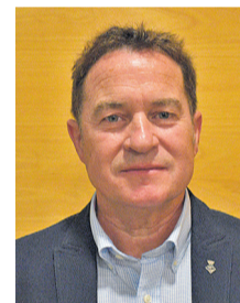
Santiago Plaza Olivares Gestió de Residus, Ciutadania i Relacions amb les Comunitats, Barris: Zona Centre i Col·legis Nous.