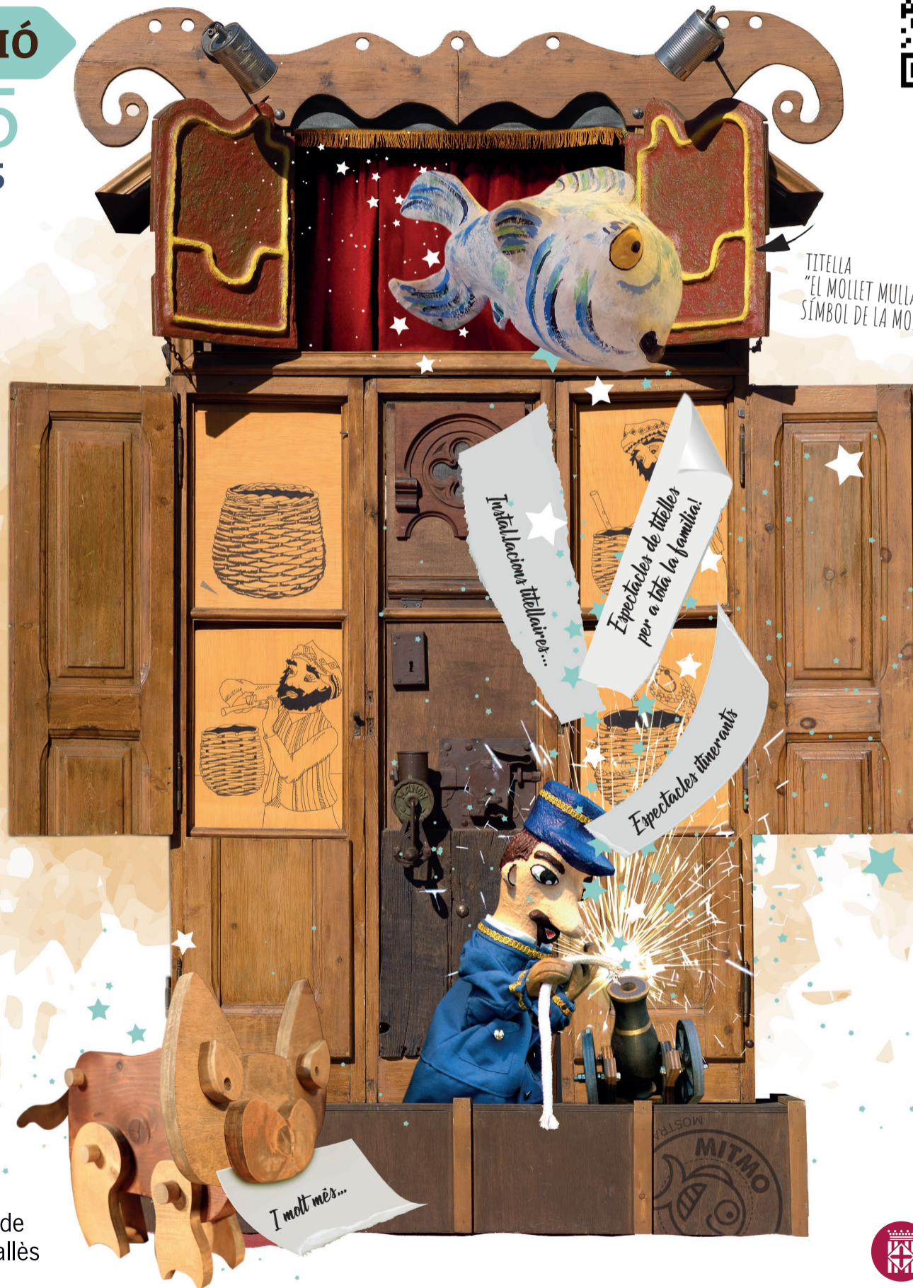
TITELLA "EL MOLLET MULLAT" SÍMBOL DE LA MOSTRA