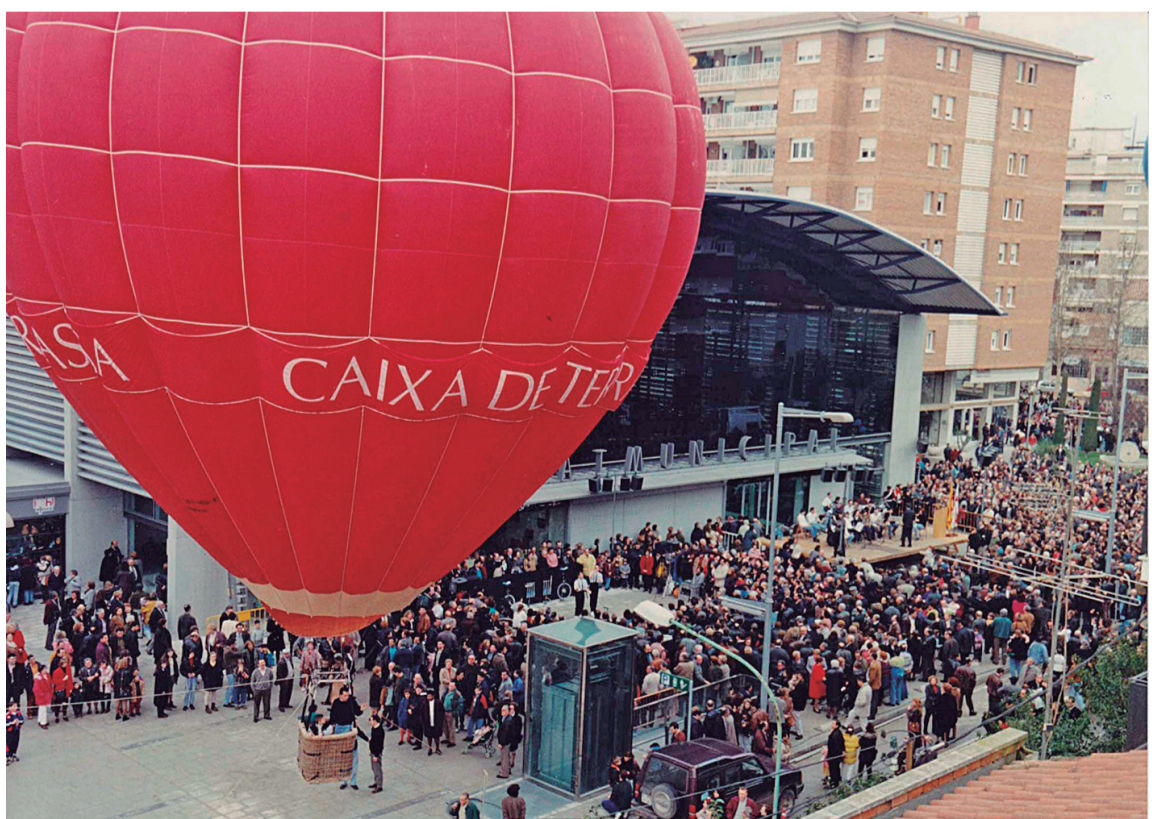
Inauguració del Mercat Municipal el 28 de gener de 1996

entrades i elements emblemàtics com l'escultura La Garri-ganga de Joan Abelló, el mercat continua sent un espai clau de punt de trobada i comerç de proximitat.