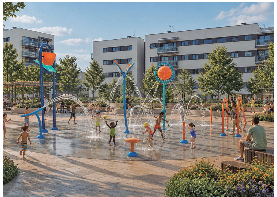
Recreació dels jocs d'aigua previstos a la plaça d'Anna Bosch

El projecte té un cost de 271.162,42 euros (IVA inclòs).