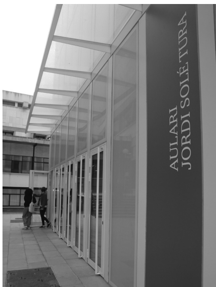
Imatge de l'entrada a l'Aulari Jordi Solé Tura. Facultat de Dret, Universitat de Barcelona