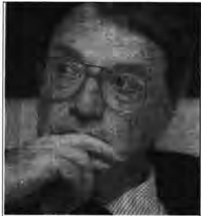
Jordi Solé Tura, ministre de Cultura