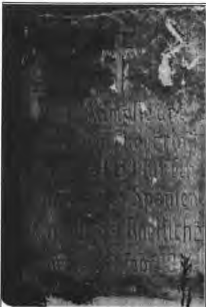
Monestit de pedra que recorda a un pilot d'un avió alemany, que va ésser abatut a Mollet. Ubicat en un principi a les Rambles, a l'actualitat es troba junt al riu Besòs, prop d'on va caure l'avió.

Santa Perpètua, poble llavors quatre vegades més petit que el nostre en nombre d'habitants tenia, a dos dels seus carrers, al costat del nom a una placa de marbre, el bust en relleu de les persones a les quals el carrer estava dedicat, unit a una breu explicació de les virtuts per les que meresqueren tal honor.