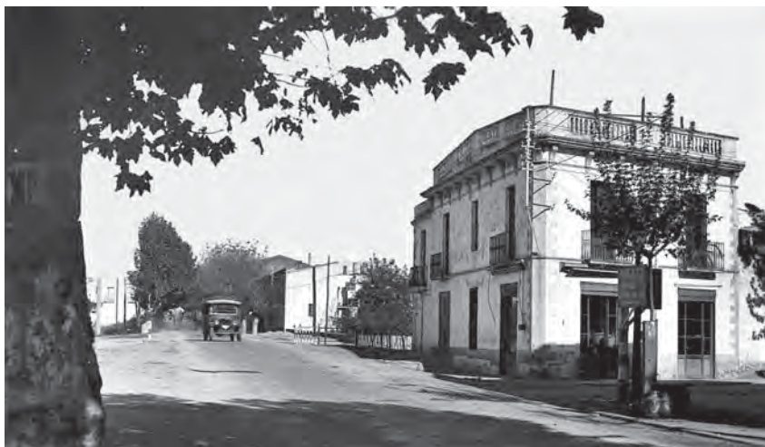
Quatre Cantons. Cal Mitjà. El 8 de gener de 1938 una bomba va caure a la banda esquerra de la fotografia, al davant d'on avui hi ha una loteria.