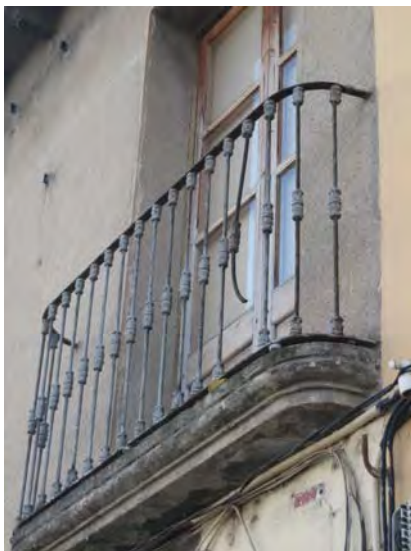
Balcó de l'antic bar la Nau, que resultà danyat per la bomba que va caure al davant de l'entrada al refugi de Can Fàbregas, on matà una persona.

Quan bombardejaven Barcelona solia ser de nit. Jo recordo aquells focos que buscaven els avions i des del terrat ho vèiem, però no anàvem al refugi. El que fèiem de vegades era posar-nos a sota el llit, però al refugi de can Fàbregas, que és el que ens tocava a nosaltres, no hi havíem anat mai. A l'escola, a ca la Barcala ens feien fer uns bastonets i quan sonava la sirena, tots ens posàvem a sota la taula, les mateixes taules del col·legi, amb el bastó a la boca. A Mollet només vam tenir dos bombardejors, però a Barcelona bombardejaven cada dos per tres, vèiem els focos des del terrat de casa i se sentia el soroll. Els últims dies van ser molt durs.