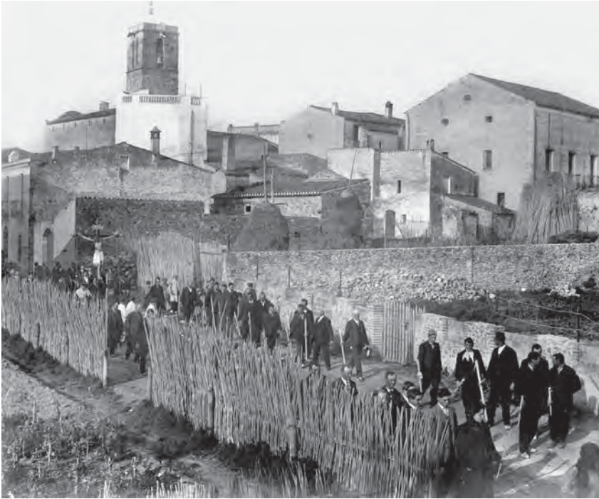
Carrer de Gaietà Ventalló, des d'on Paquita Naqui va sentir el bombardeig dels Quatre Cantons.

a la mà i també va quedar allà estesa 22 . Era de cal Bondéu, al capdamunt de Mollet, s'havia casat i va anar a viure cap al capdavant de Mollet. I ella venia de buscar la troneta perquè ja estava molt adelantada i pobreta, allà es va quedar.