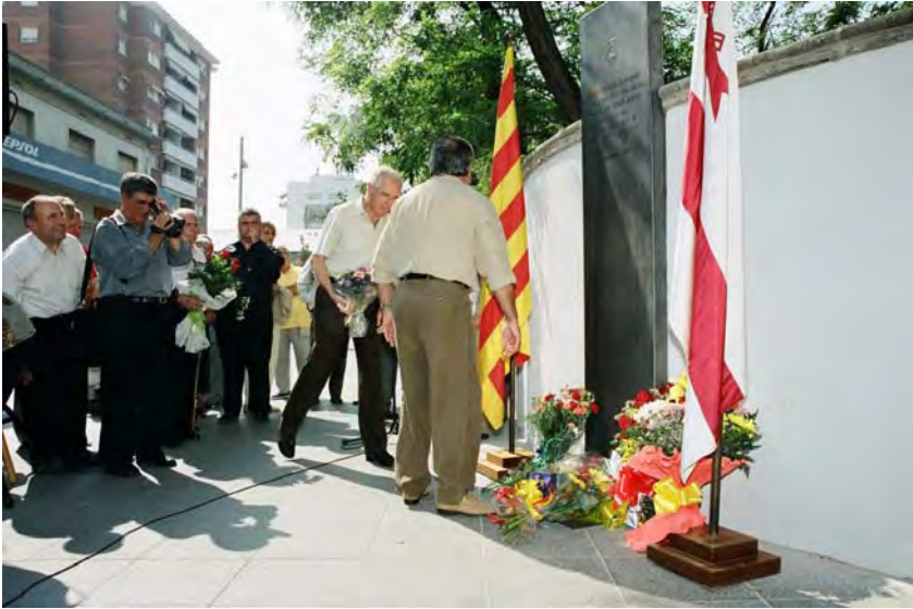
Homenatge a les víctimes dels bombardejos de Mollet, octubre de 2002.