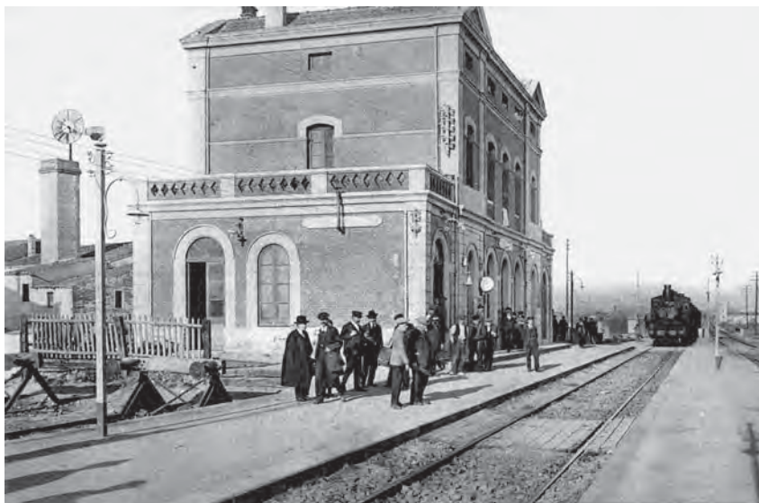
Al final de la guerra, un tren ple de material i menjar va quedar estacionat a l'estació de França.