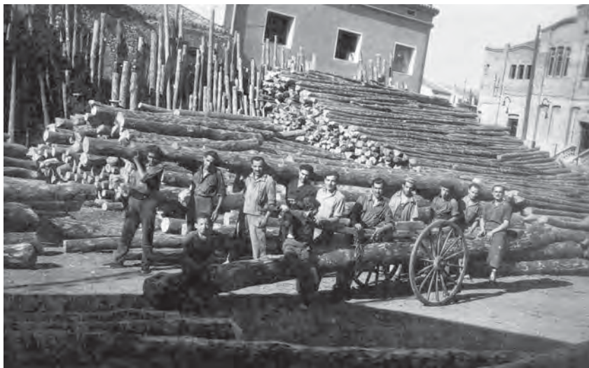
Magatzem de fustes de cal Medir. Al costat hi havia els horts de darrera les cases de Berenguer III on va caure una bomba entre el pati de cal Baster, el paller del Vilà i darrera del cal Tiffon.

On ara és cal Rebull hi vivien la Sra. Rosa, el seu marit i els germans Moretó 7 , el Miquel i els altres. Amb el Miquel érem de la mateixa edat i havíem jugat junts, perquè ells tenien la casa i un barri que arribava fins a la farmàcia Foz, en punxa. A l'altra banda del carrer hi havia primer el Gabriel (l'home de l'Enriqueta Llonch), després un tros de terreny on no hi havia res, llavors veníem nosal-