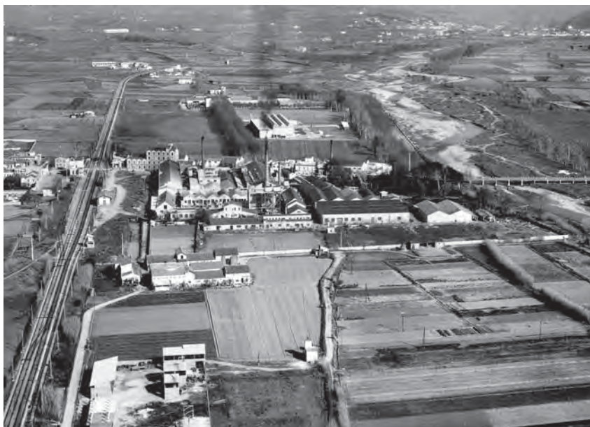
L'estació del tren, la Pelleria i el riu Besòs, un lloc estratègic per als bombarders feixistes italians.