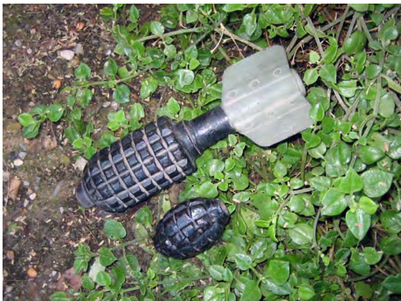
Bombes trobades a l'estació del Calderí de Gallecs el 19 de març de 1939.