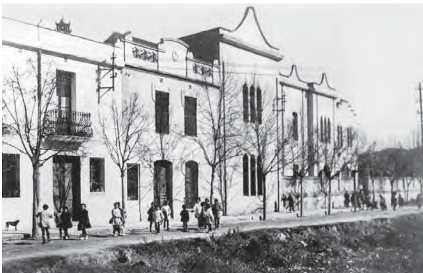
Col·legi de les monges, seu de la CNT durant la guerra.