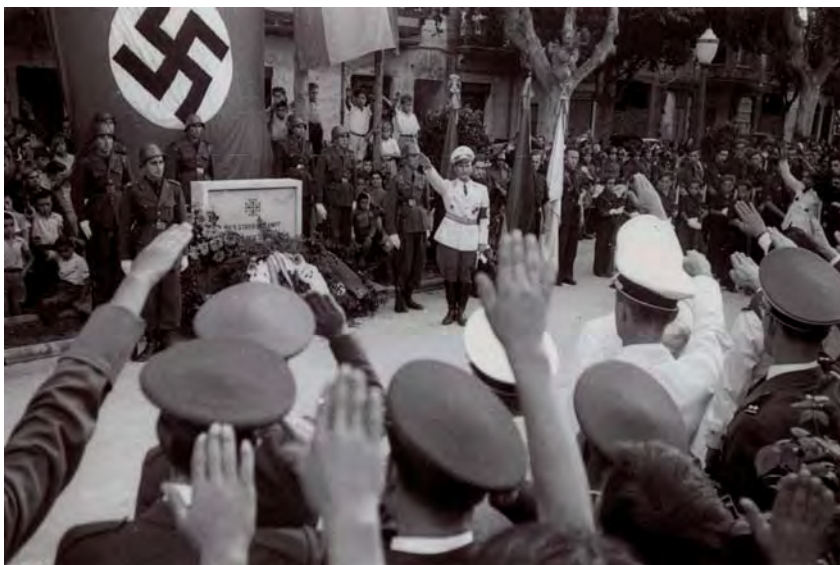
Homenatge nazi a Walter Eckert, a la rambla de Mollet a l'alçada de Berenguer III, el 30 d'agost de 1941.

Després de la guerra, recordo el dia que van fer l'homenatge en aquest aviador nazi, a prop del Casal, i va venir un piquet de tropes alemanyes i li van retre un homenatge, presentant armes, disparant i totes aquestes coses.