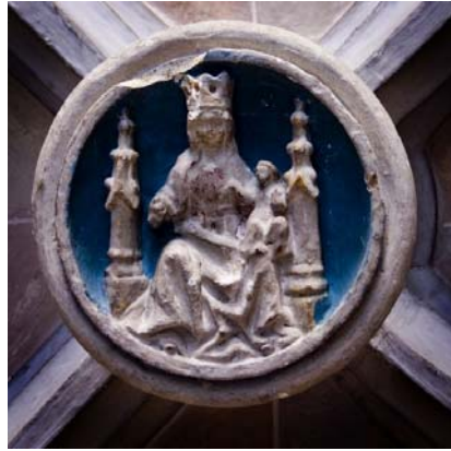
Rosetó de la volta del cor renaixentista.

Destaquen a l'interior certs elements ornamentals com el manteniment de pintures murals a l'absis de la capella de Sant Joan, a la nau de migdia, d'estil barroc; el cor renaixentista decorat amb quatre elegants figures dels evangelistes i un rosetó a la clau de volta amb la imatge de la mare de Déu de l'Heura. Element important en una església és la pica beneitera que a Santiga és del s. XVI.