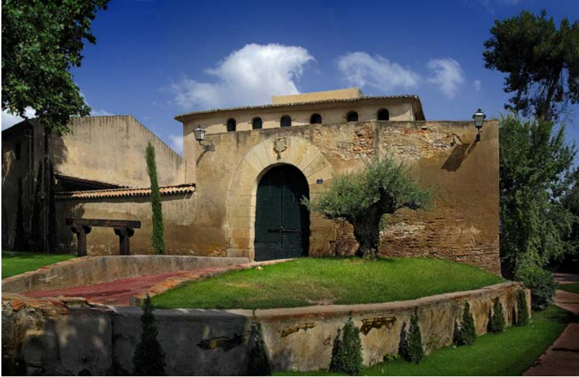
Imatge actual del Castell de Mogoda.

Actualment al paratge de Santiga, hi conviu una estructura quasi aturada en el temps amb el castell; les cases construïdes entre els segles XVI i XVII, a davant i a ponent del castell per als treballadors; l'hostal que també era del senyor; la casa rectoral i l'església, al costat de les naus industrials dels polígons del segle XX i XXI que caracteritzen l'economia de Santa Perpètua de Mogoda actual.