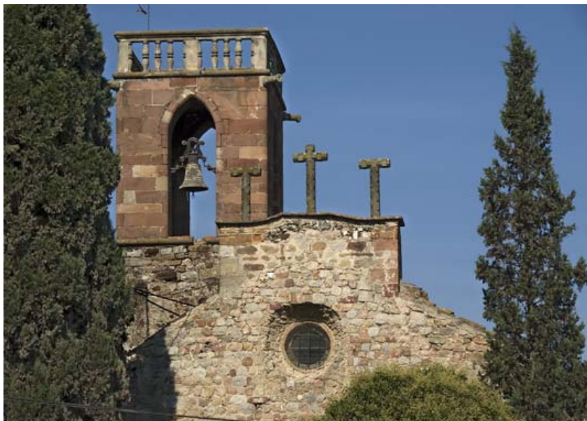
El calvari barroc i el campanar.

Puig va saber retratar la bucòlica nostàlgia del món rural que a Santiga ha sobreviscut, miraculosament, a tocar dels polígons industrials.