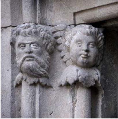
Detall de la porta modificada el 1574.