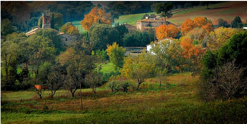
Paisatge de Santiga.

Aquest mosaic agroforestal s'ha protegit des del punt de vista urbanístic en el Pla general municipal de Santa Perpètua de Mogoda amb la qualificació de sòl no urbanitzable de valor ecològic paisatgístic d'ús dominantment agrícola