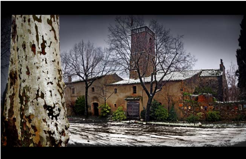
Un inusual Santiga nevat on es pot apreciar l'entrada a la rectoria i l'hostal.

Tota aquesta estructura que embolcalla l'església de Santiga, abans que rectoria, va ser un important hostel que donava servei al camí reial que anava de Granollers a Sabadell.