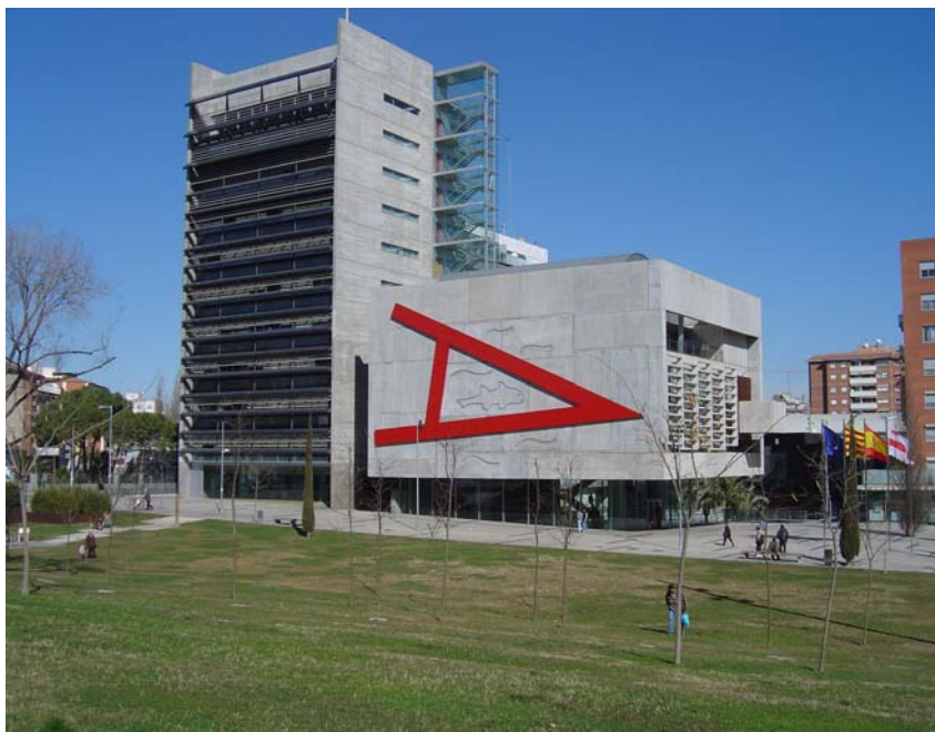
El mural finalitzat.

política, social i cultural i el ressorgiment cultural, cívic i nacional de Catalunya malgrat la duresa política, cultural i social de la dictadura cruel del general Franco; Joan Brossa, va establir amb Mollet una vinculació que ja serà viva per sempre; un vincle que unirà indistriablement la nostra ciutat i, especialment, la nostra primera institució, amb la creació poètica brossiana.