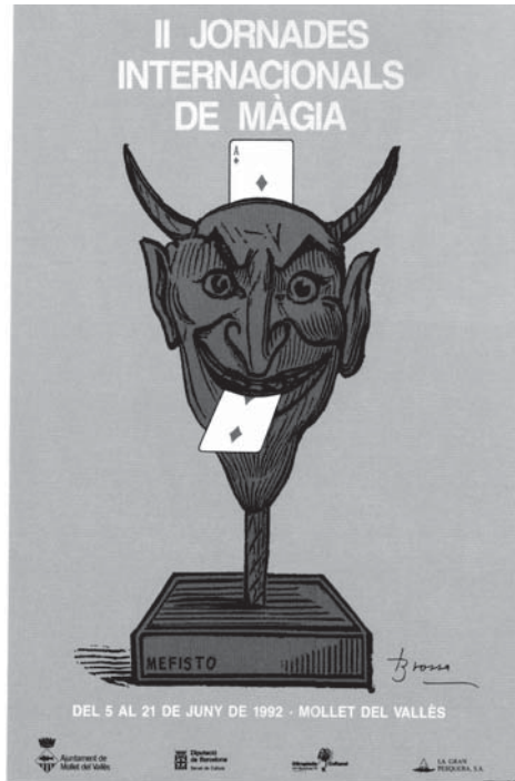
Cartell de les II Jornades Internacionals de Màgia

de Barcelona, amb una exposició de material per a la màgia, en garantien la qualitat.