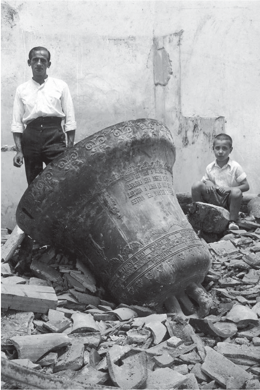
Campana de l'església destruïda. L'ABANS, recull gràfic de Mollet del Vallès.