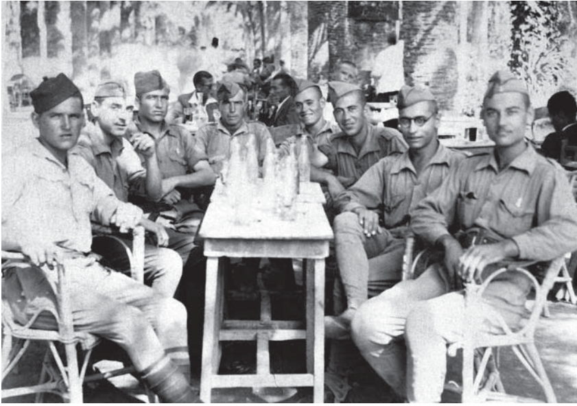
Quinta del 1941, coneguda com a "Quinta del biberó", ja que tenien 17 anys. L'ABANS.

La repressió i l'eliminació de qualsevol manifestació de la cultura catalana va ser una de les altres principals preocupacions del nou Règim. En una acta del 3 de març de 1939, poc més d'un mes després de la presa de Mollet per part dels nacionals, trobem la reclamació de la desaparició urgent dels noms amb significació roja en els noms dels carrers, així com que "el idioma Oficial Nacional de los letreros, propagandas, reclamos, etc." 26 sigui el castellà. És per això que no tornem a trobar referència al canvi dels noms de carrer fins l'acta del 26 de maig de 1939, en la qual es comunica definitivament que: "visto el escrito de la Comandancia Militar de Granollers, se acuerda sea ordenado por pregón la obligación inmediata del cambio de letreros y propaganda al idioma oficial español, con la imposición de multas correspondientes por haber sido ya anunciado en público, la mentada obligación" 27 .