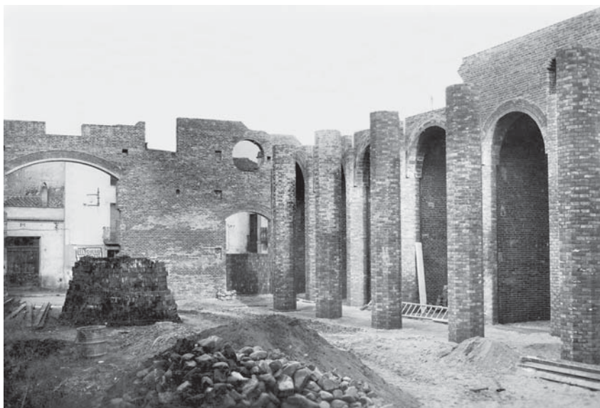
Fotografia presa després de la destrucció de l'església. L'ABANS, recull gràfic de Mollet del Vallès.

L'octubre de 1939 va estar dedicat a les celebracions de festes locals i nacionals, una d'elles, com ja hem esmentat, va ser la del dia de la Hispanitat, però una altra que també fou rellevant va ser la que s'aprovà al ple del 28 d'octubre. Mollet, després de patir molts problemes durant el govern local de la II República, a l'època franquista l'Ajuntament s'aferrà a les tradicions catòliques i eclesiàstiques, sobretot de cara als escolars que utilitzaren la religió cap a ells com a eina de control. En aquell ple es va debatre sobre la festivitat religiosa que se celebrà en commemoració als caiguts per tal de fomentar el espíritu als estudiants de les escoles: