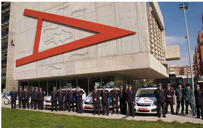
Presentació dels nous cotxes de la Policia Municipal davant la Casa de la Vila.

Tornem a Mossos i Policia Municipal. Respecte, coordinació, recursos, experiència, companyonia, treball en comú, mesa única de