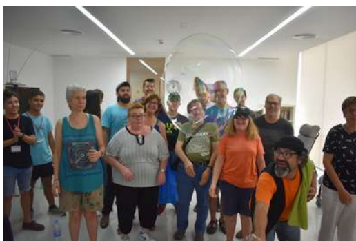
Funcions a l'Hospital Sociosanitari (a les imatges de l'esquerra) i al Centre Educatiu Juvenil Els Til·lers (a la imatge superior)