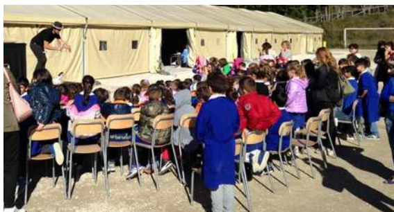
Infants d'Arquata. Itàlia 2016.