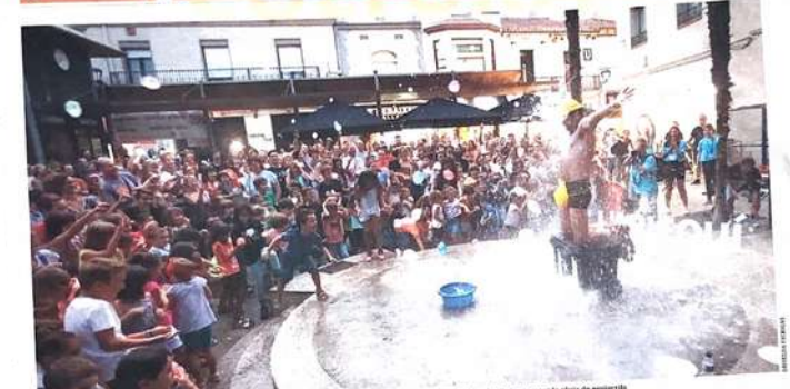
Al final de l'actuació del Pesse Peix, l'artista va espantar gossos i aigua perquè el públic els llançés. A la imatge, el 'clown' galtes encanona la pluja de projectils.

Titelles per inaugurar el nou curs de La Tramolla INSCRIPCIONS AL CURS DE LA BERGAMINI PODOLAR Dissabte tindrà lloc la 18a edició de La Bergamini.