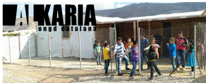
Escola de l'assentament de refugiats. Líban 2017.