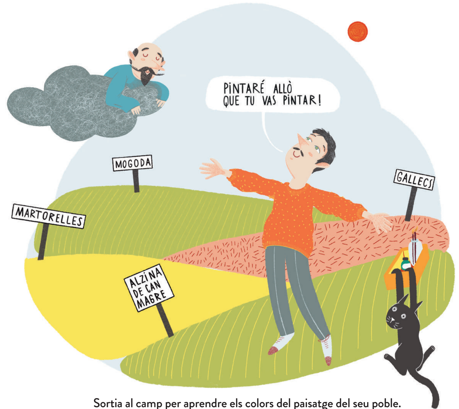
Sortia al camp per aprendre els colors del paisatge del seu poble.