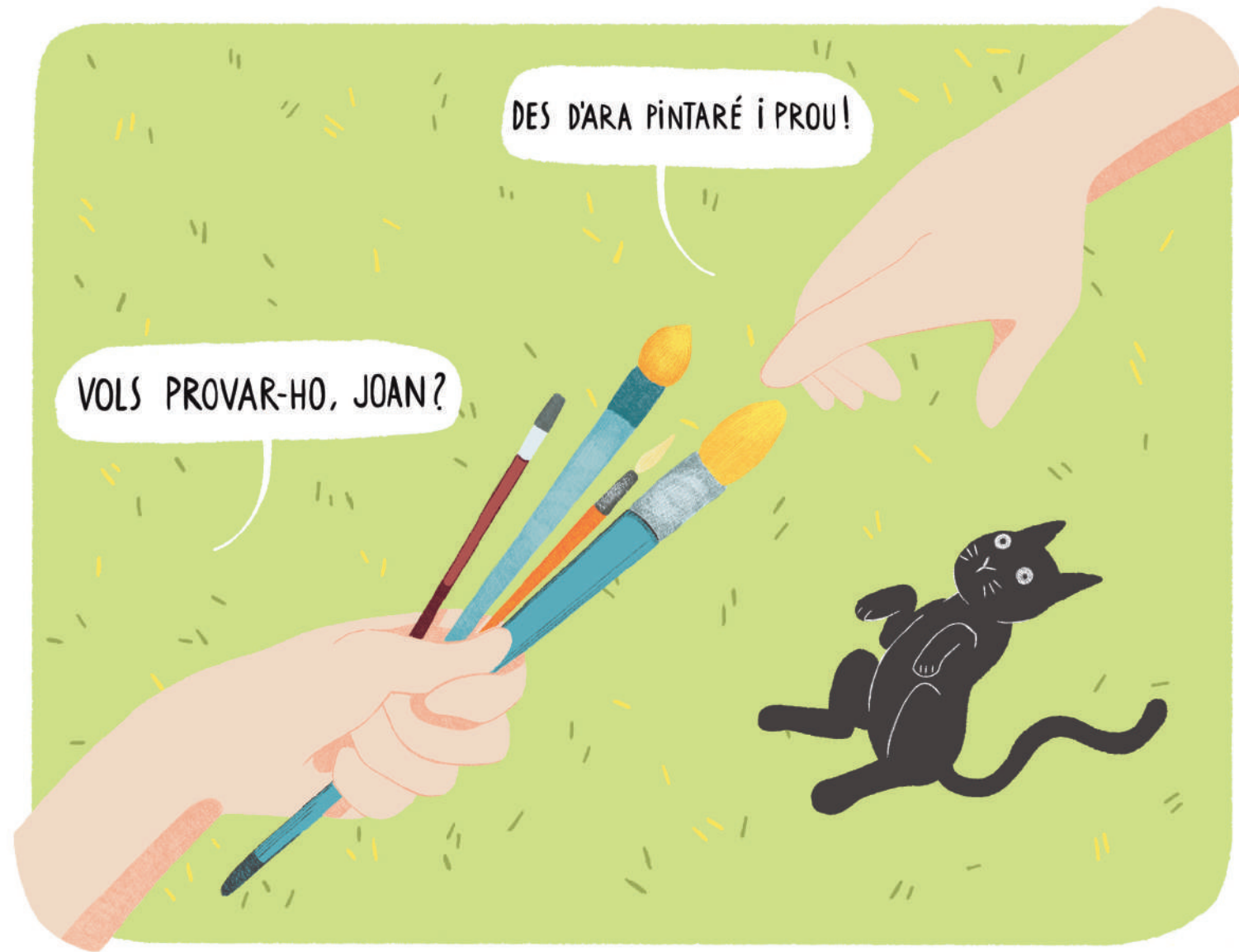
Un dia, el vaig veure agafar els pinzells que li oferia un pintor.