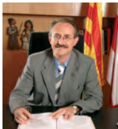
Josep Monràs i Galindo Sindaco Alcalde

Piccole città ma con grandi ambizioni come quella di creare, giorno per giorno, un'Europa fatta di cittadini, di giovani impegnati e solidali. Lavoriamo a pieno ritmo per la costruzione e l'affermazione dell'Europa.