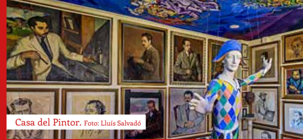
Casa del Pintor.