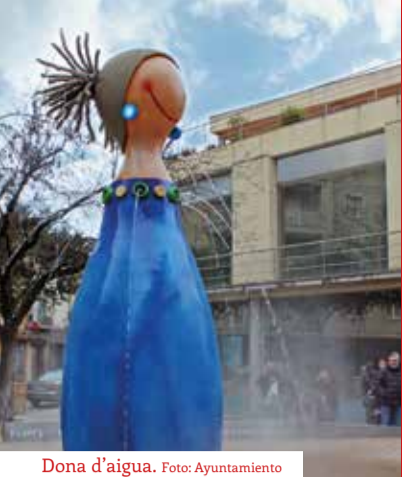
Dona d'aigua.