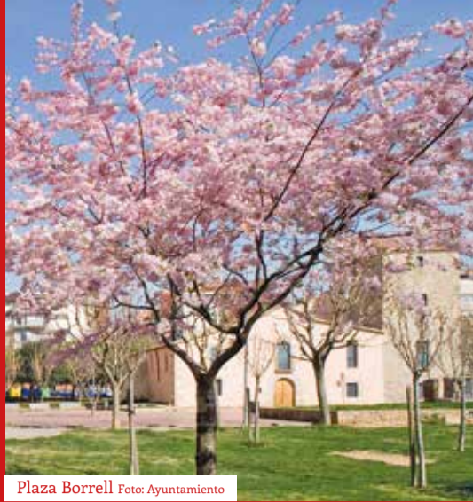
Plaza Borrell