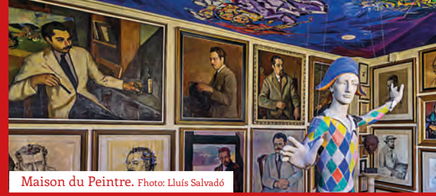
Maison du Peintre.