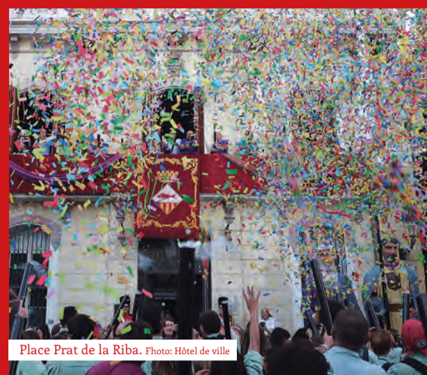
Place Prat de la Riba.