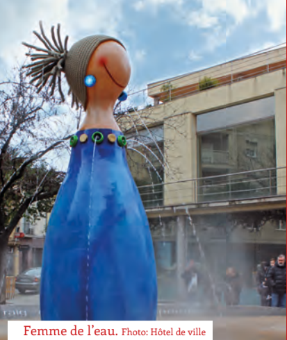
Femme de l'eau.