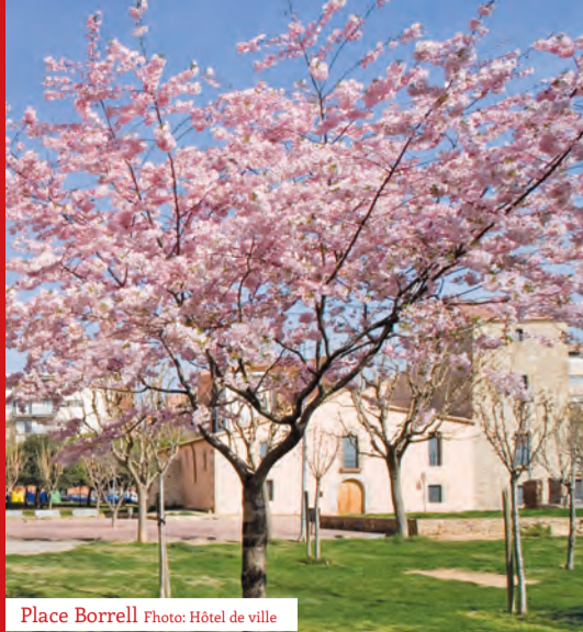
Place Borrell