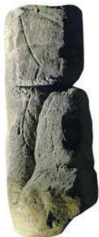
La Pedra de Llinàs → Montmeló