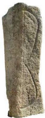
Menhir de Castellruf → Santa Maria de Martorelles