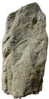
La Pedra Llarga → Palau-solità i Plegamans