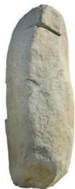
La Pedra Serrada → Pareds del Vallès