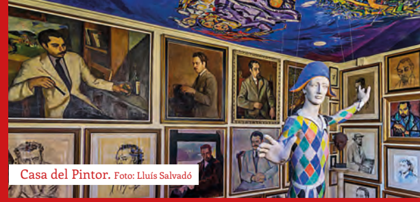
Casa del Pintor.