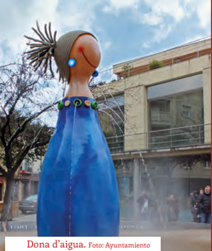
Dona d'aigua.