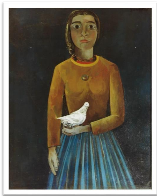
Dona amb colom. 1958. Josep Guinovart. Oli sobre tela