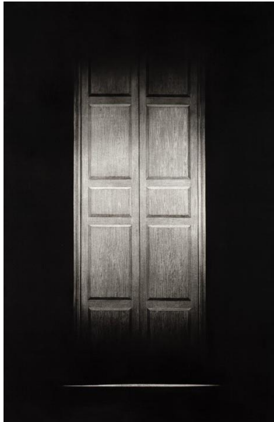
Sense títol. 2020. Isidre Manils. Carbonet sobre paper